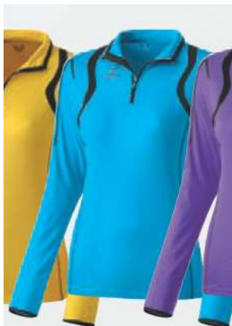
14 schwarz 833115 curacao/schwarz