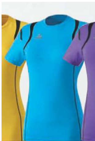
14 schwarz 808115 curacao/schwarz